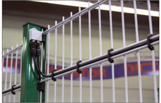
Zu den Sicherheitsmaßnahmen von Gebäuden gehören Überwachungssysteme und Perimeterschutz.