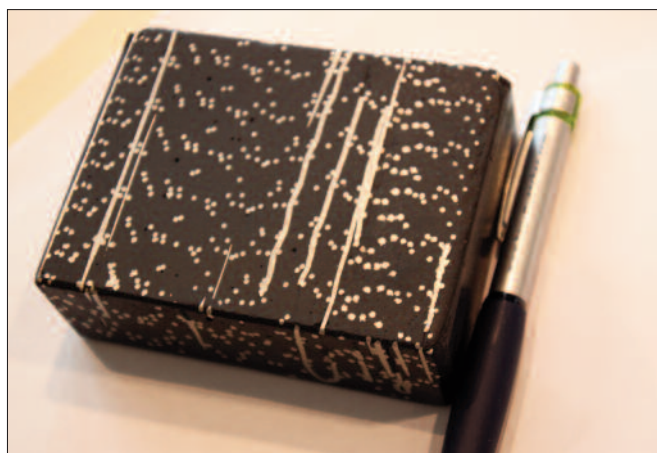
Der Ducon-Beton besteht aus vielen Lagen von Gittermatten mit Drahtstärken von einem bis zu drei Millimetern.

(höchsten) Widerstandsklasse RC6 wird mit einer Wandstärke von 7,5 cm erreicht. Die Überdeckung der Gittermatten mit Beton ist nur einige Millimeter stark.