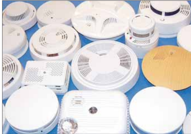
Je nach Einsatzort gibt es verschiedene Rauchmelder.

Durch eine Abdecküberwachung wird auch in unscharfem Zustand erkannt, ob der Bewegungsmelder abgedeckt oder das Meldefenster besprüht wurde. Ultraschall- und Mikrowellenbewegungsmelder beruhen auf dem Doppler-Prinzip: Die Frequenz einer reflek-