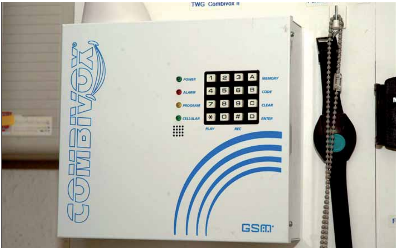
Einbruchmeldeanlagen sind ohne ergänzende Sicherheitstechnik selten effizient.