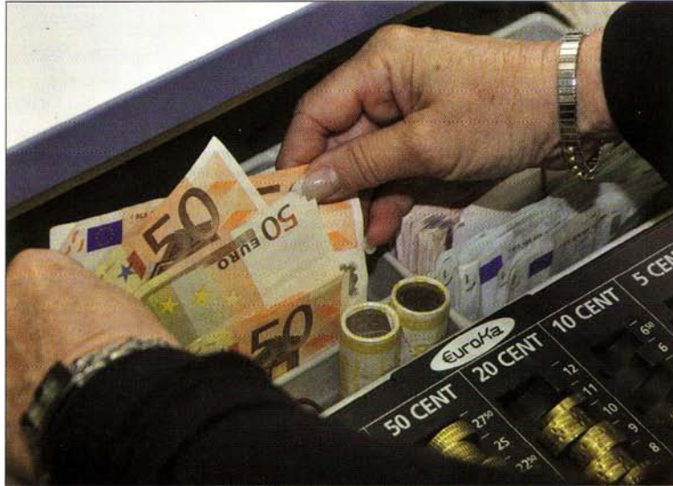
Diebstahl gehört zu den „klassischen“ Mitarbeiterdelikten – neben Veruntreuung, Korruption, Betrug und Untreue.

Laut dem Einzelhandelsinstitut entstand durch kriminelle Handlungen von Mitarbeitern im Jahr 2007 in Deutschland ein Gesamtschaden von einer Milliarde Euro. Schätzungen beziffern den durch Mitarbeiter verursachten Schaden zwischen einem und fünf Prozent des Umsatzes, und eine Befragung von 1.700 Managern in Europa ergab, dass zehn Prozent der Trennungsverhandlungen Unehrllichkeit als Hintergrund haben.